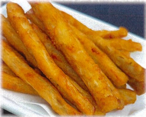
【ゴボウの唐揚げ】 792円(税込)