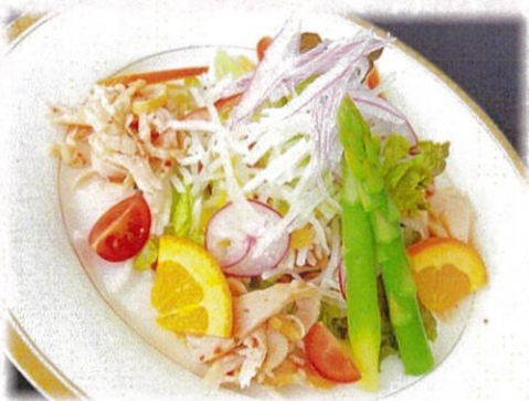
【彩り野菜サラダ】 660円(税込)