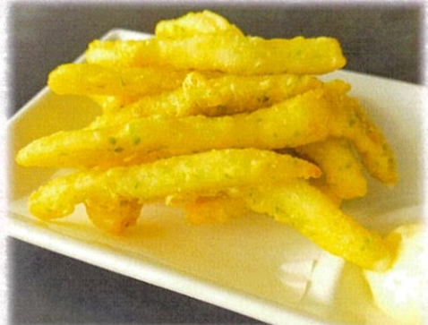
【イカの磯辺揚げ】 605円(税込)