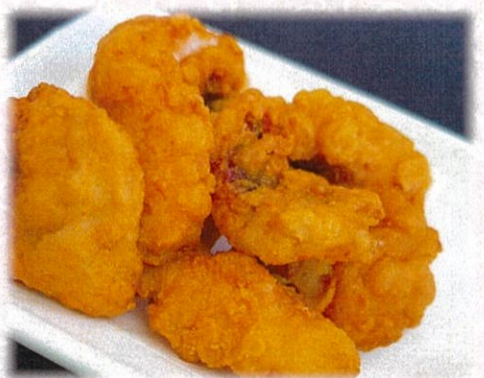
【タコの唐揚げ】 770円(税込)