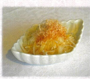
【オニオンライス】 484円(税込)